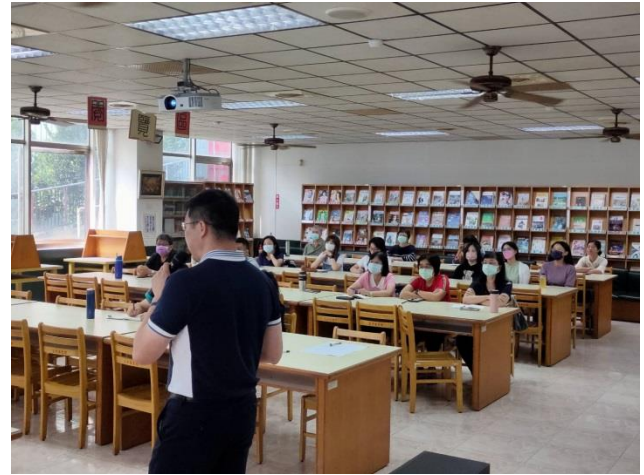
國際教育內容說明(一)