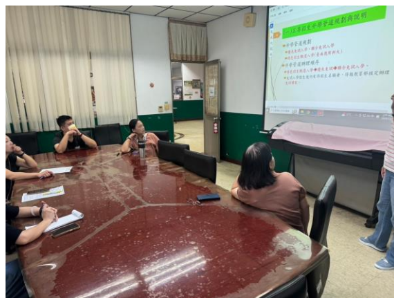
五專升學管道規劃說明