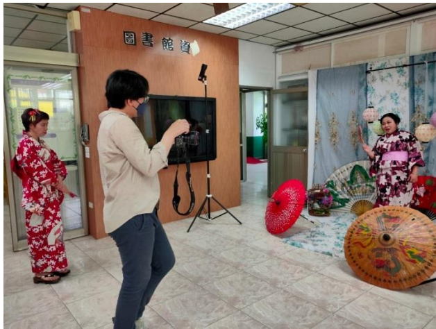
攝影棚與服裝搭配說明