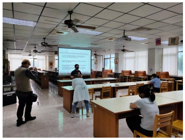
講師示範拍照技巧