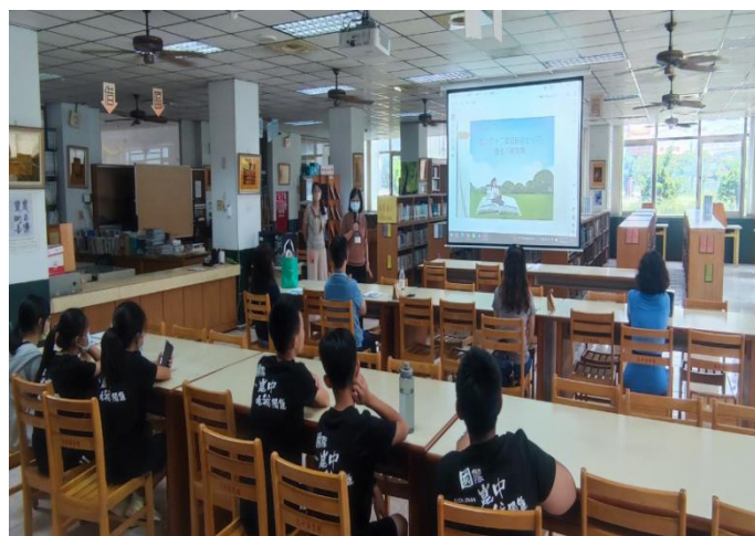
十二年基本教育說明及生涯發展家長宣導