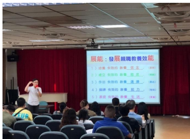
112.9.16 董事長致辭歡迎家長蒞臨