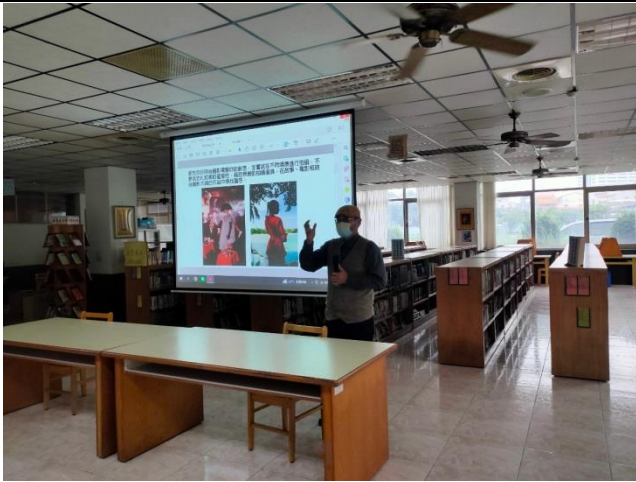
時尚攝影作品介紹(一)