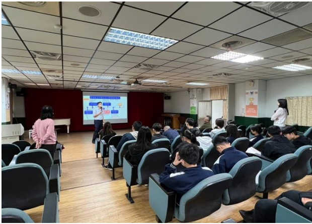
適性入學綜合場-周校長演講