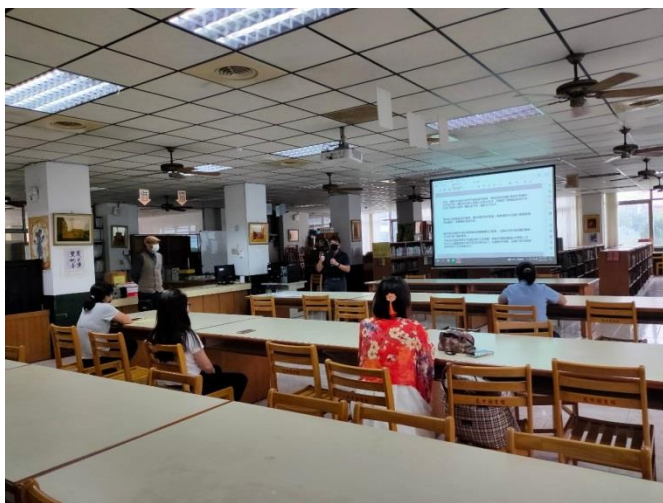
時尚攝影作品技巧說明