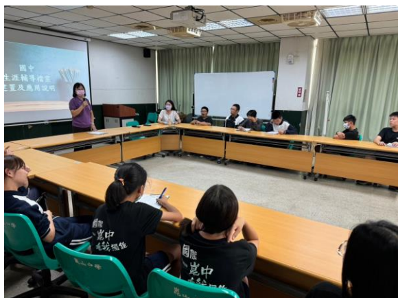
112.10.2 生涯檔案建置說明