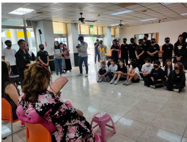
向師生說明整體造型彩妝