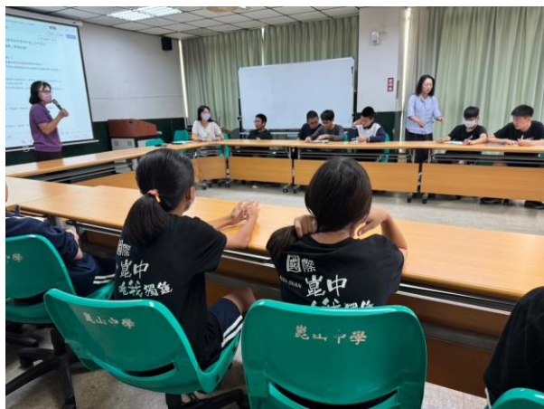
生涯檔案計畫說明