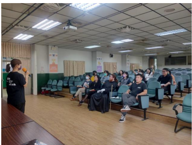
現代藝術與彩妝的關係