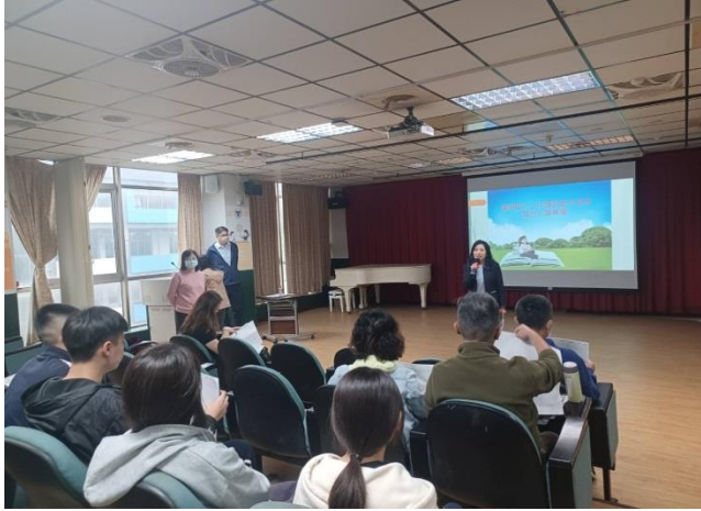
適性入學綜合場-校長開場