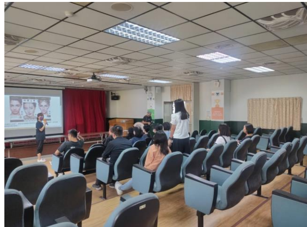
不同膚色的彩妝方式