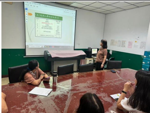
免試入學比序方式說明