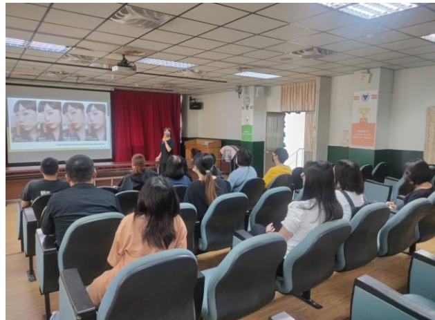
不同色彩彩妝之呈現方式