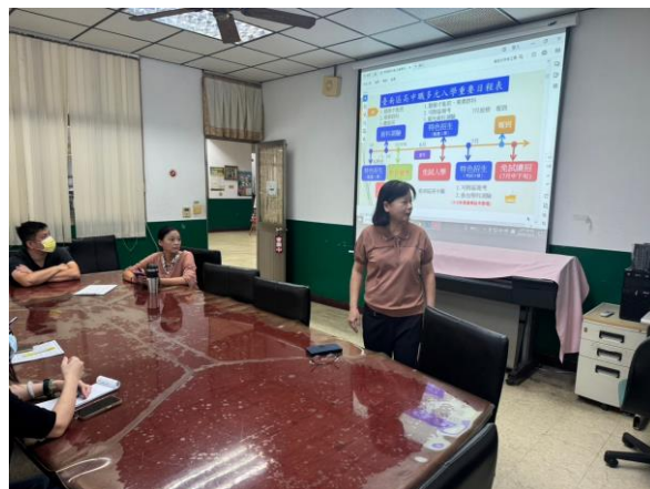
多元入學重要日程