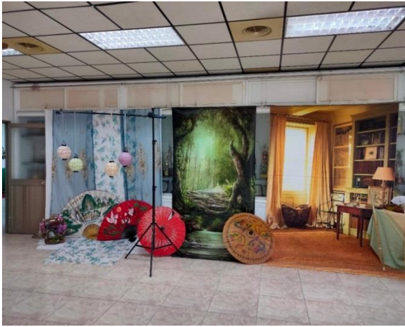
112.5.3 攝影棚背景設計介紹