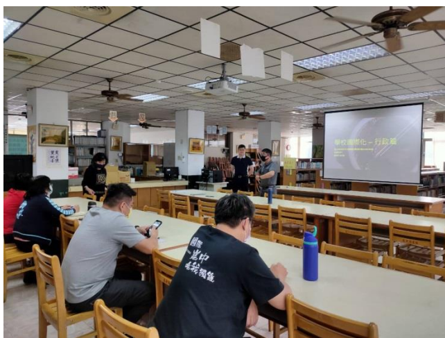
製作外語履歷表並上傳