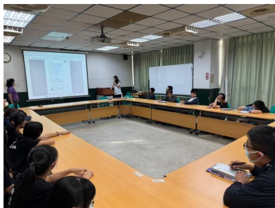
檔案內頁書寫方式說明