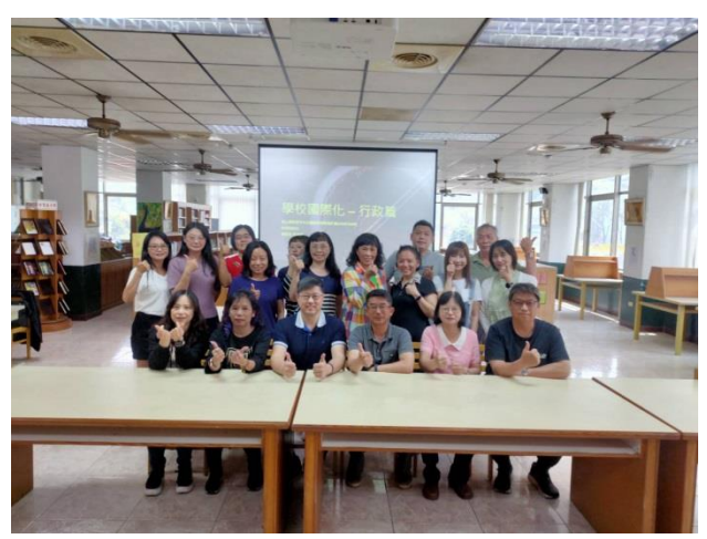
同仁完成國際教育工作坊