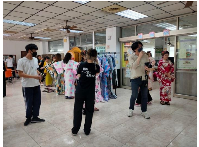
整體搭配環境說明