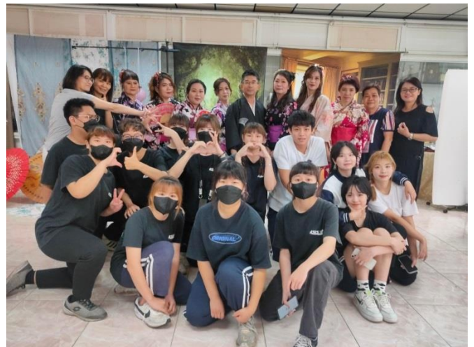
教師、家長及學生參與整體造型活動研習