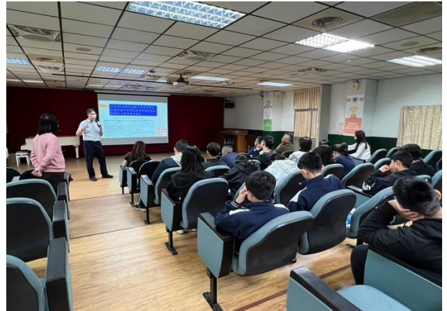
適性入學綜合場-周校長演講