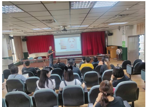
臉部彩妝柔和度介紹