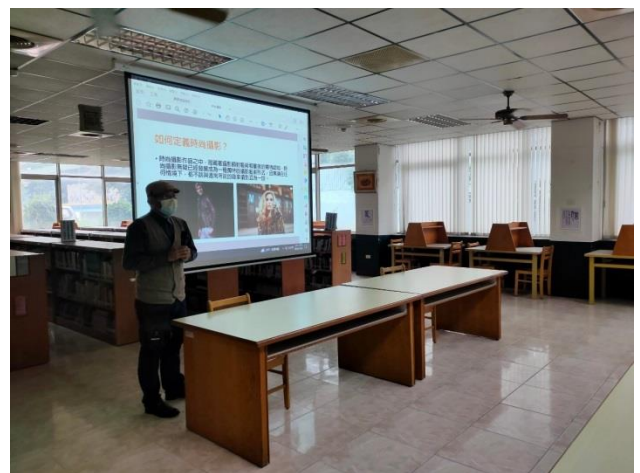
時尚攝影作品介紹(三)