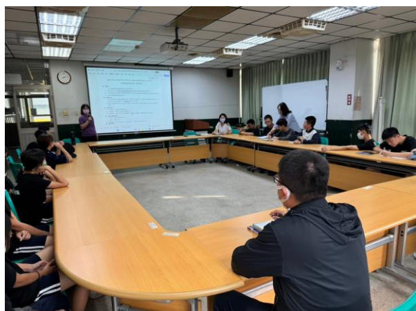
生涯檔案與未來發展說明