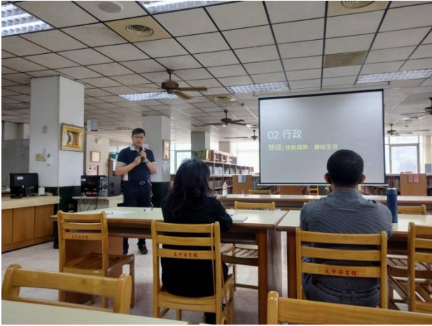
112.4.8 講解國際教育包含項目