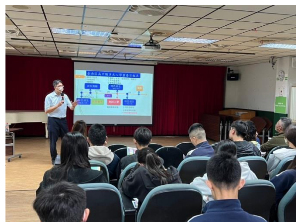
適性入學綜合場-周校長演講