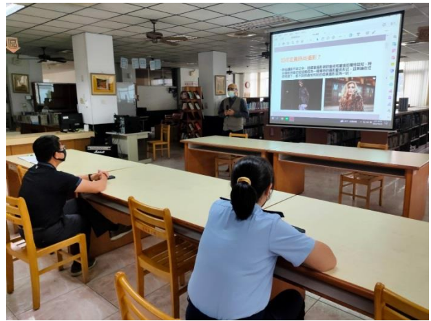
時尚攝影作品介紹(二)