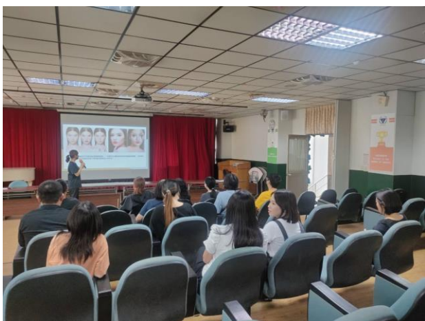
112. 10. 25 當代藝術融入時尚教師研習