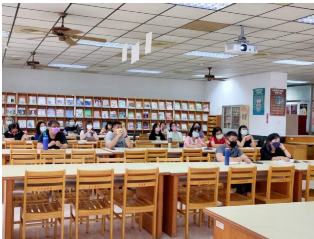
國際教育內容說明(二)