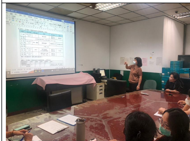
討論子計畫內容(一)