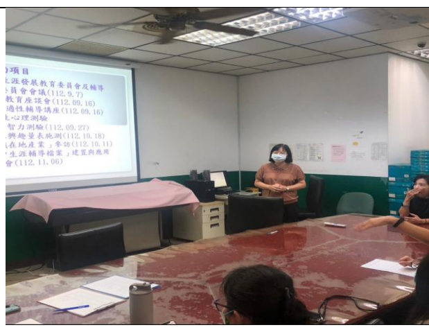
各子計畫實施時間