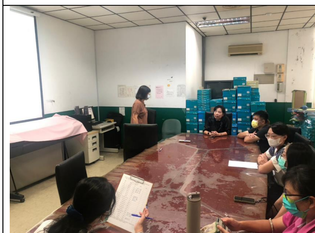
校長了解與會人員