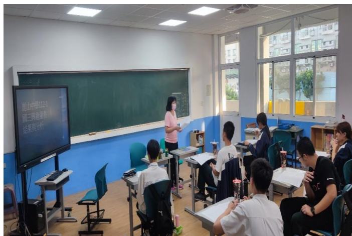
112.11.1 生涯興趣量表施測結果解釋