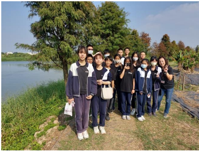
六甲菁埔埤落羽松秘境