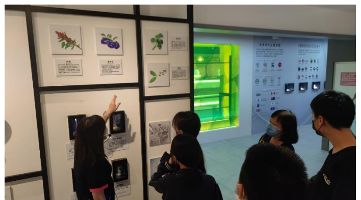
參觀台鉅美妝，導覽員解說植物特性