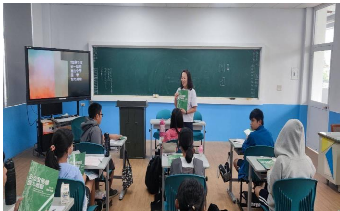
國一智力測驗施測