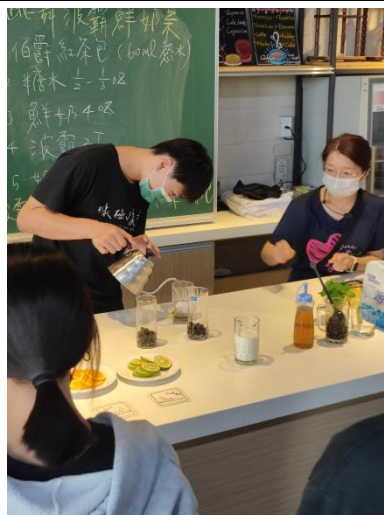
跳舞波霸鮮奶茶示範