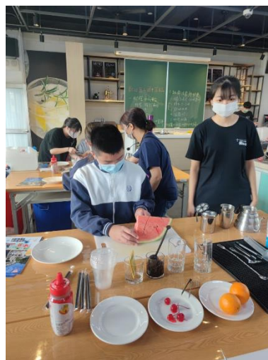
柳橙西瓜盤造型製作