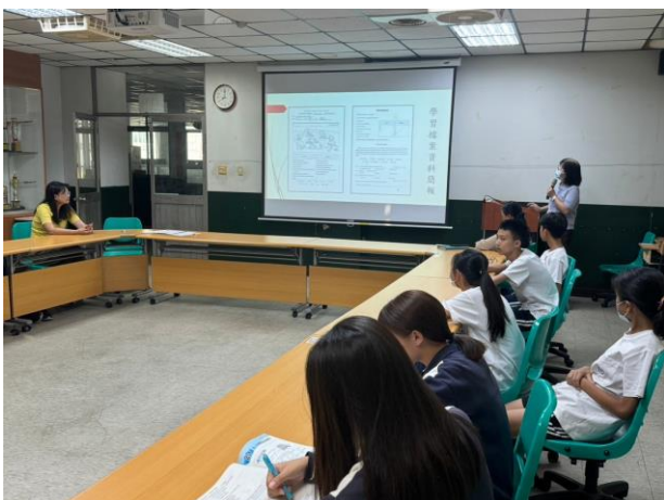
生涯檔案內頁資料檢視