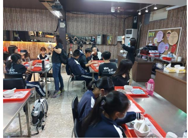
天一中藥 DIY 製作