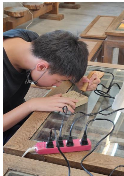
專注鏤刻自己的作品