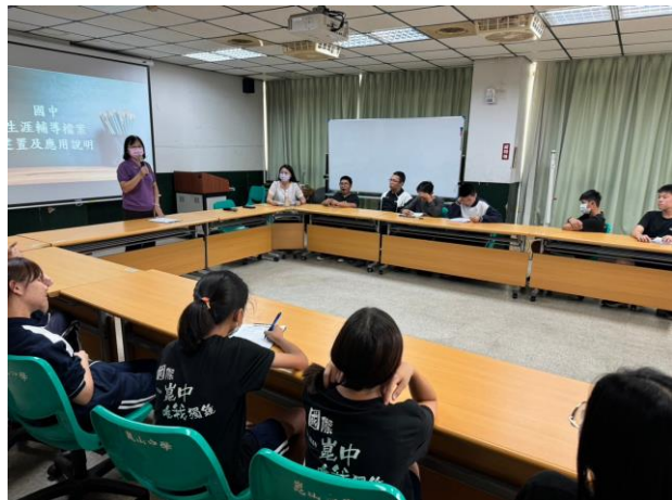
112.10.2 生涯檔案建置說明