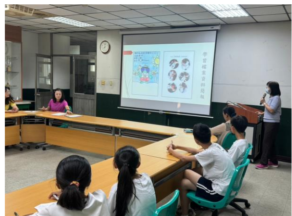
生涯檔案封面創意設計