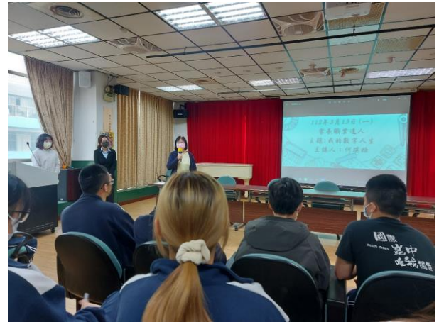
何瑛姬家長介紹他的數字人生