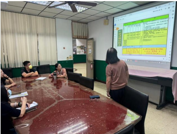
多元表現計分方式