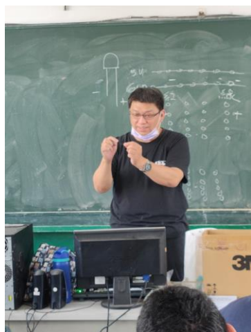
老師講解資訊電子原理