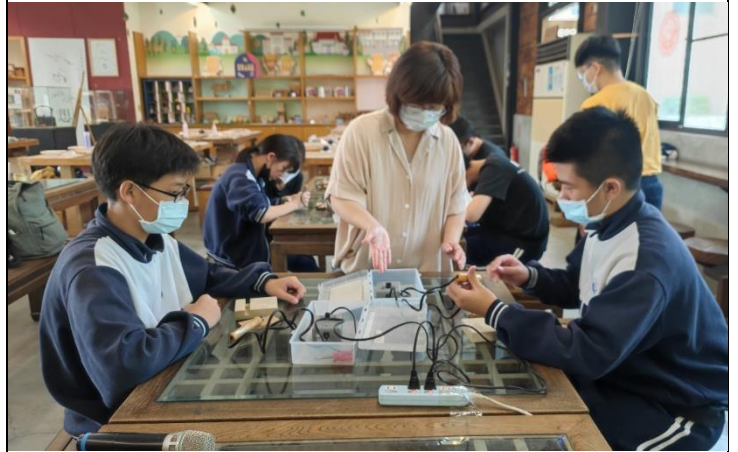
家具博物館 DIY 製作