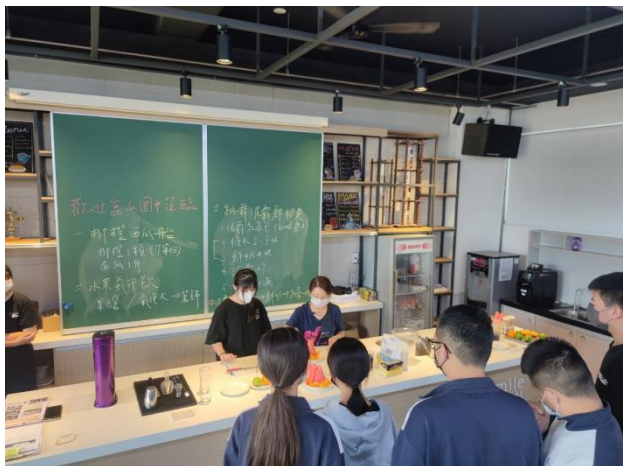
112.4.12 參訪家齊高中餐飲管理科