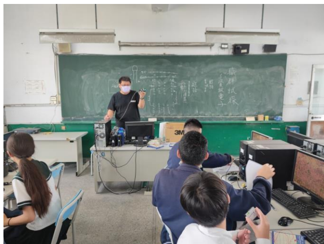
112.5.3 資訊電子課程介紹