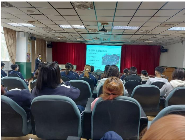
提醒學生培養職場基本能力