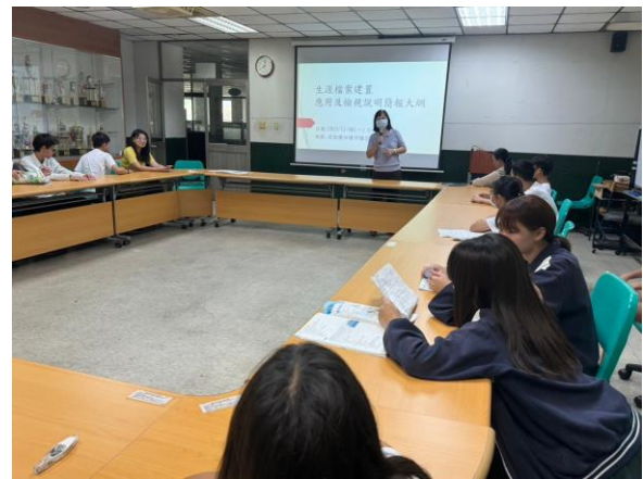
112.11.6 生涯檔案建置與檢視