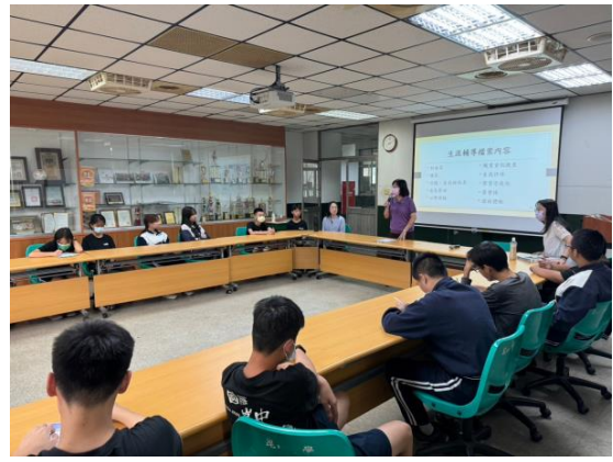
生涯檔案建置目次說明