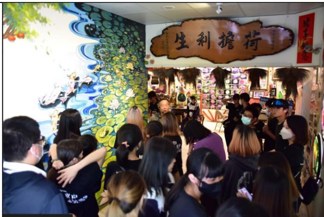
九品蓮生態教育園區導覽