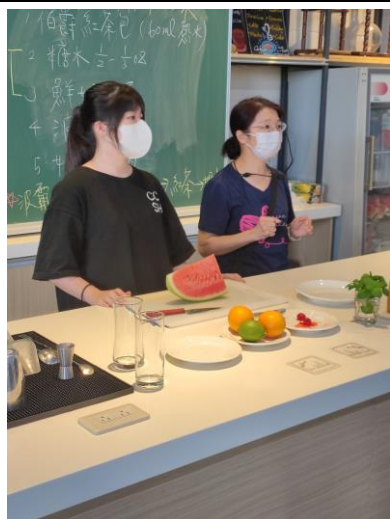
柳橙西瓜盤造型示範