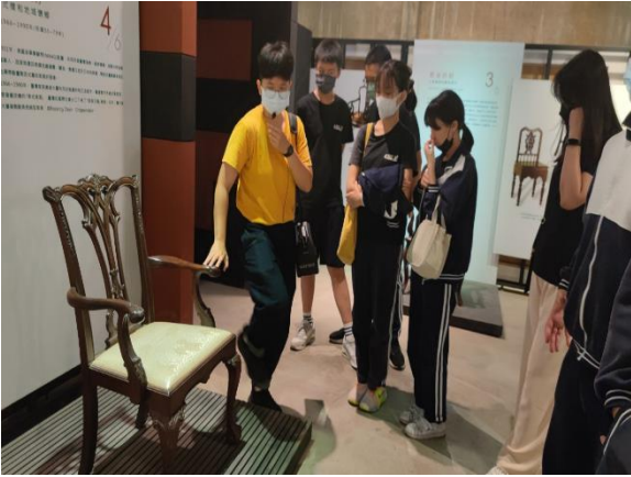
家具博物館導覽員解說家具特色