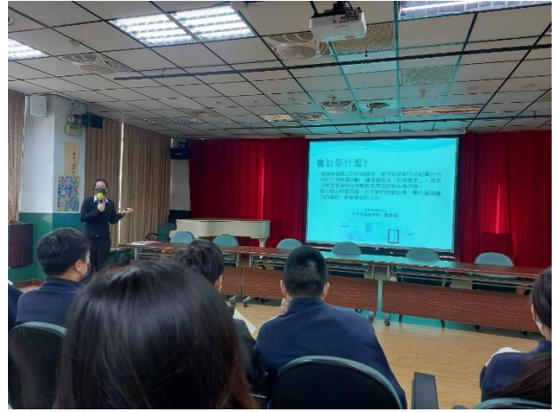
解釋會計工作內容