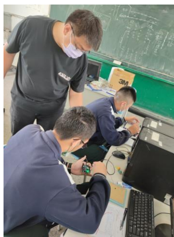
老師指導實際操作