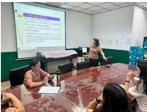
上網志願選填日程表說明