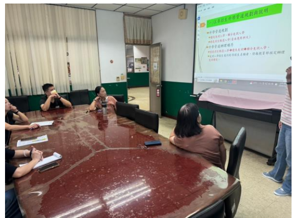
五專升學管道規劃說明