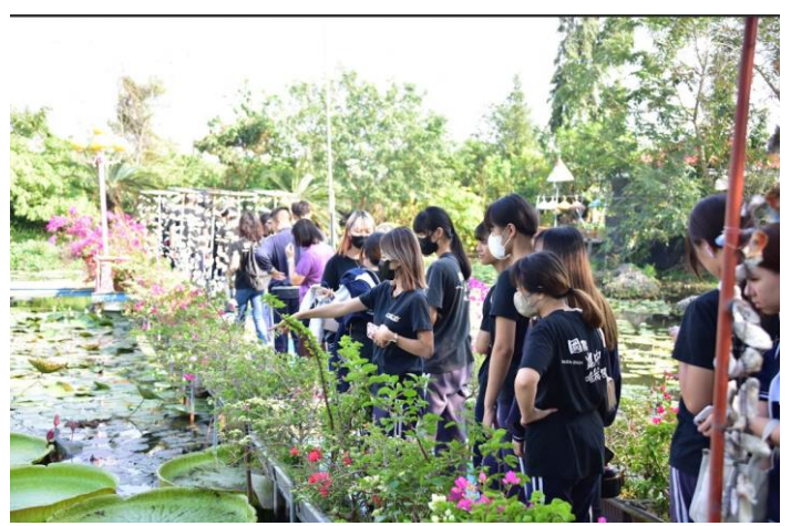
九品蓮生態教育園區參訪