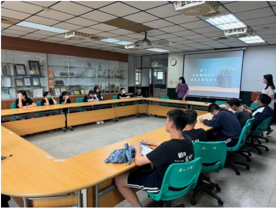
112.10.2 生涯檔案建置方式說明