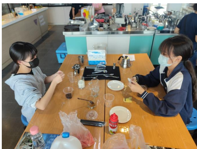
跳舞波霸鮮奶茶製作