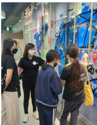
台鉅美妝導覽員介紹原料