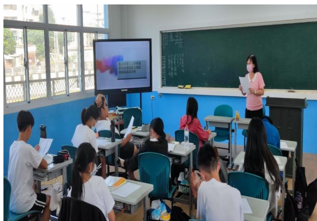
112.11.1 智力測驗結果分析