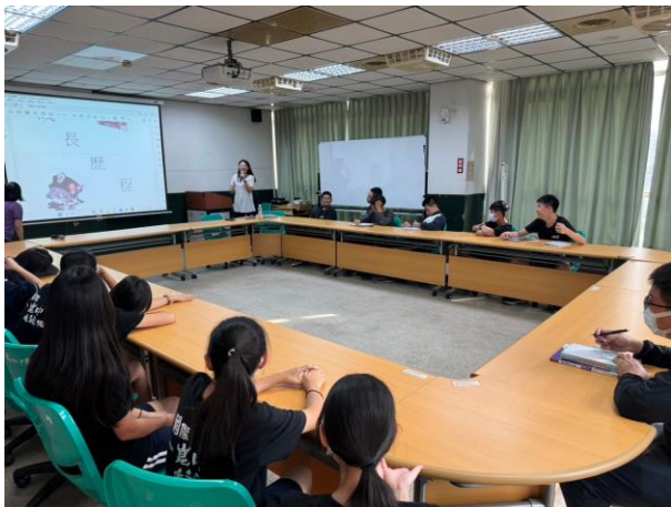
生涯檔案內頁製作方式