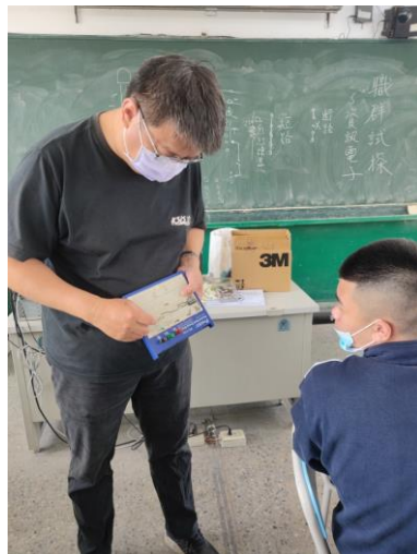
資訊電子面板製作示範