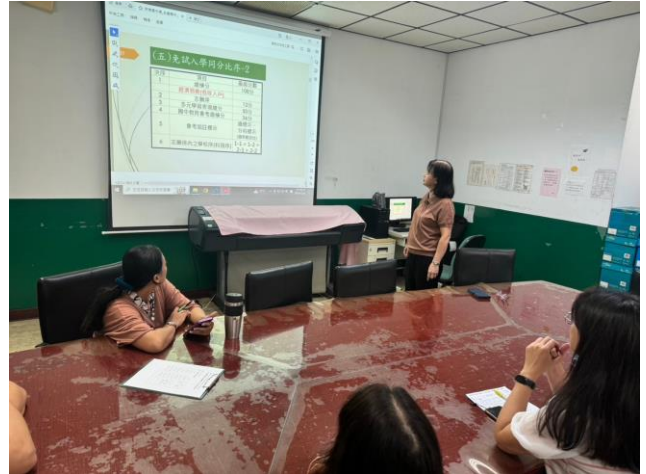
免試入學比序方式說明