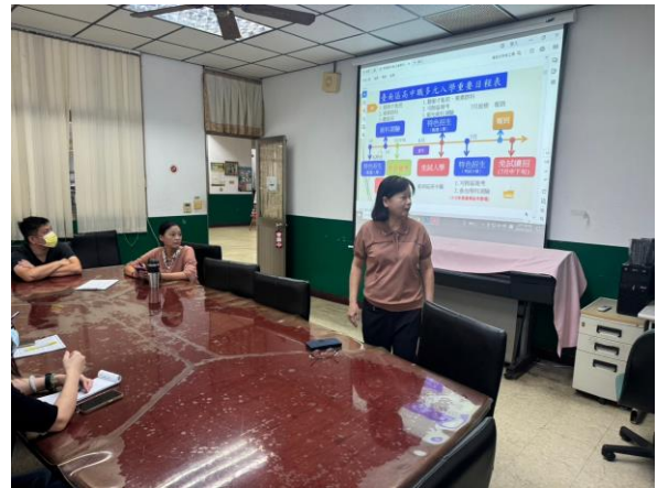
多元入學重要日程